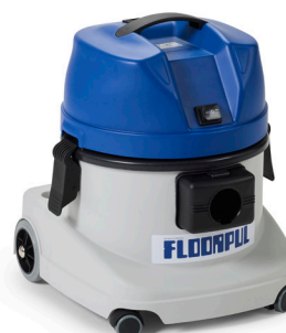
KV 15 Li

Uitgerust met HEPA 14 motorfilter, Filtratie voor steriele ruimtes Equipé filtre moteur Hepa 14, filtration Salle blanche