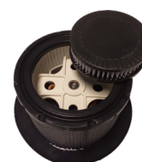
Speciale HP14 filter voor steriele ruimtes Filtre H14 Special salle blanche

Filterpatroon HEPA 14 / Microvezelzak Cartouche hepa 14 / Sac microfibre