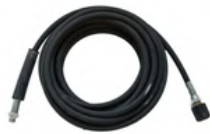
HOGE DRUKSLANG 20 METER