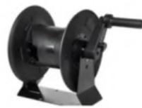
SLANGHASPEL 20 METER